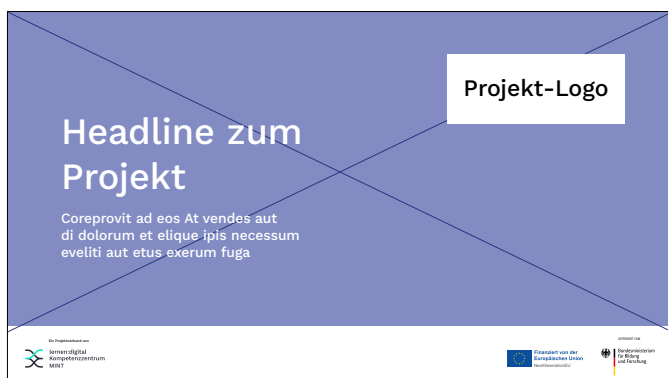
Beispiel Video-Format 16:9