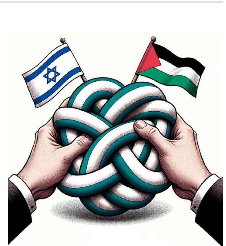
Vorschläge für Karikaturen zum Nahost-Konflikt